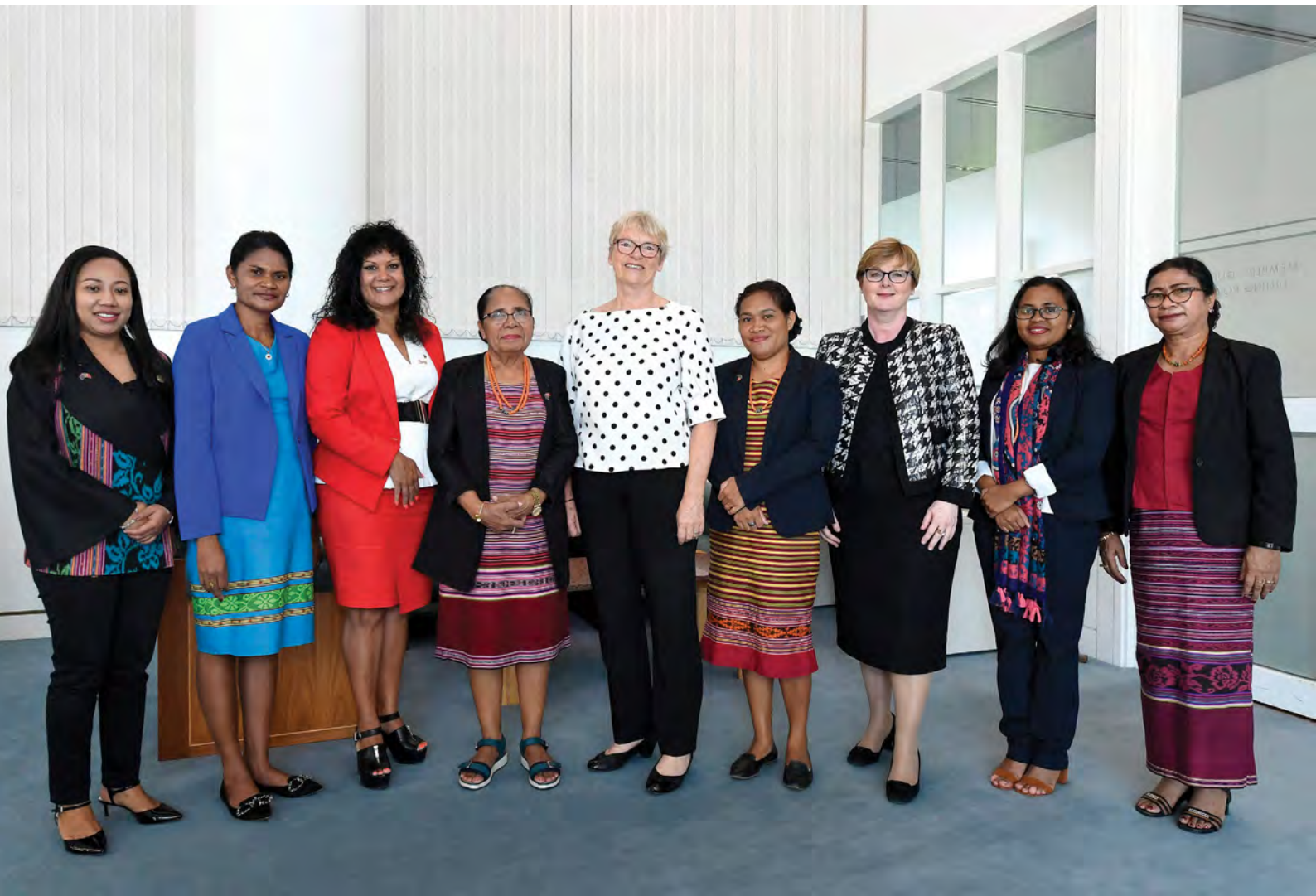
Timor-Leste and Australian MP Project participants