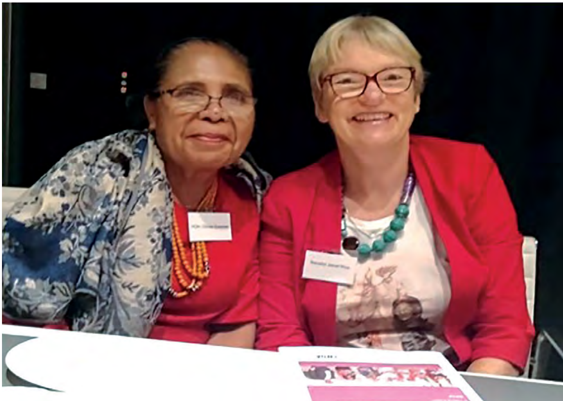
Hon Olinda Guterres and Senator Janet Rice

Ho hanoin hanesan, MP ida husi Timor dehan katak projetu ne'e sai plataforma ida ba MP sira atu fahe esperiénsia ba malu no aprende katak MP fetu sira iha dezafiu sira-ne'ebé hanesan.