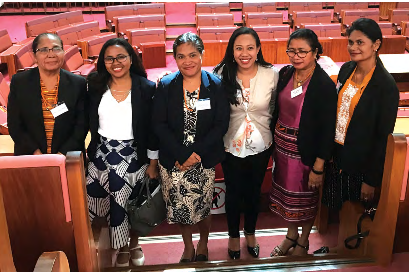
Timor-Leste MPs in the Australian Parliament

Bazeia ba projetu nia objetivu sira, kritéria ba selesaun participante koko atu rekruta MP sira ne'ebé iha ona kometimentu ba igualdade jéneru, no ho representasaun husi partidu polítiku sira. GMPTL asume responsabilidade atu nomea MP Timor-Leste sira. Husi partidu hitu iha parlamentu, neen inklui MP feto. Kada partidu husi partidu neen sira-ne'e ho membru MPs feto, nomea MP ida atu partisipa iha projetu ne'e. MP feto sira mai husi partidu prinsipál tolu. Na'in rua husi MP Australia sira-ne'ebé partisipa iha Timor-Leste partisipa uluk ona iha projetu ne'e iha Myanmar.